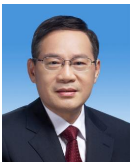
หลี่ เฉียง Li Qiang