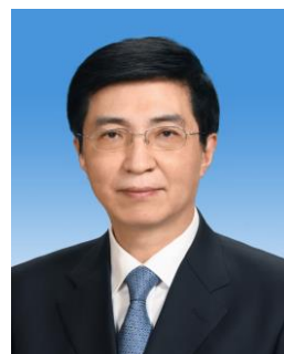
หวัง ฮู่หนิง Wang Huning