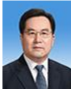
ดิง เสวี่ยเซียง Ding Xuexiang