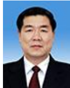
เหอ ลี่เฟิง He Lifeng