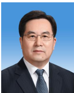
ติง เสวี่เซียง Ding Xuexiang