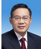
หลี่ ฉีแยง Li Qiang