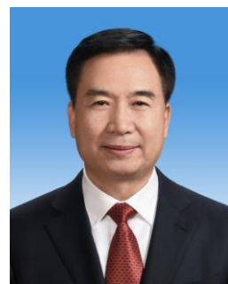
หลี่ ซี Li Xi