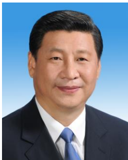
สี จิ้นผิง Xi Jinping