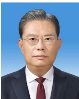
จ้าว เล่อจี้ Zhao Leji